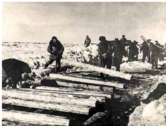
Prisonniers construisant une ligne de chemin de fer.

Dans ce récit, durant les trois premiers jours, Yahvé agit par séparation : il sépare la lumière des ténèbres ; les eaux du ciel des eaux d'en bas ; la terre de la mer. Vous avez compris l'allusion ? Ils affirment que les Juifs doivent rester un peuple séparé de leurs vainqueurs ; leur vocation est de ne pas se laisser assimiler par les adorateurs d'idoles ; Dieu les a appelés à rester un peuple séparé, comme Il sépare les éléments.