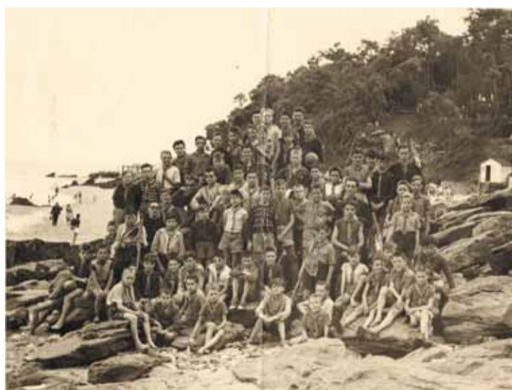
Vous avez été un organisateur hors pair de colonies de vacances.