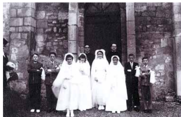
Les "grandes communions", au temps où les abbés étaient en soutane, les garçons en brassard, et les filles habillées comme des petites mariées.