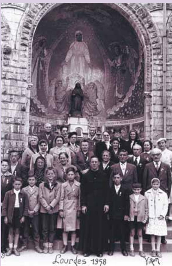
Avec vos paroissiens, à Lourdes. (1958)