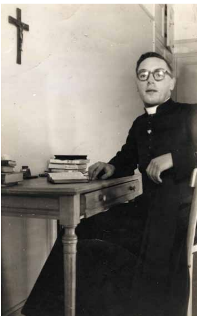
A votre bureau de travail.