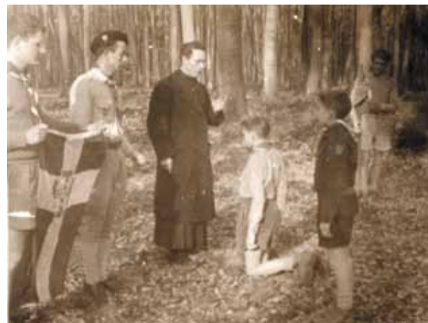
Vous présidez les promesses.