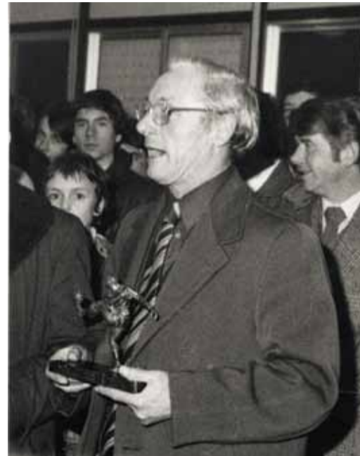
Vous rayonnez de joie en tenant un trophée de football.