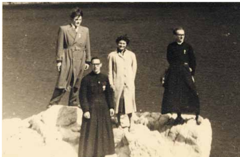
Vous voilà en sortie, dans les Alpes.