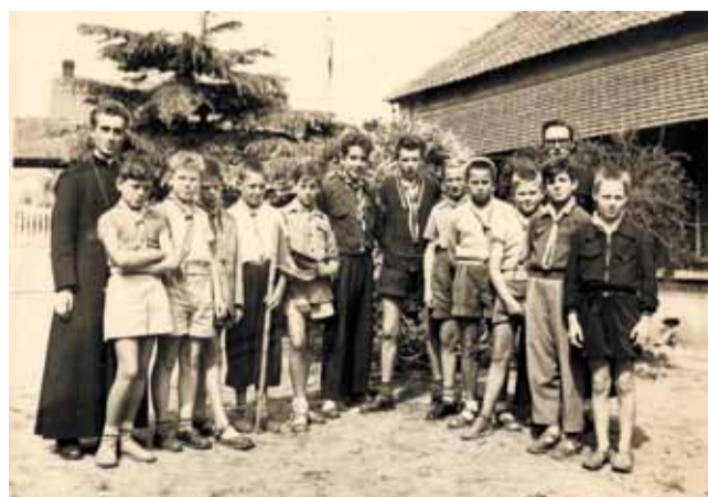
Vous avez été l'aumônier d'une troupe scout. (1954)