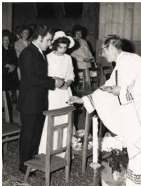
Vicaire à Pont-Sainte-Maxence, combien de mariages avez-vous célébrés ? (1972)